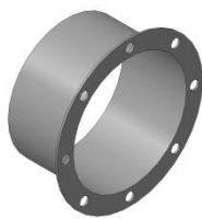
Тип «Ф» (фланец)