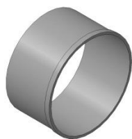
Тип «Х» (хомут)